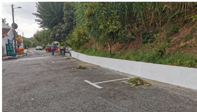
Trabalhos de pintura levados a cabo em Vale de Guizo