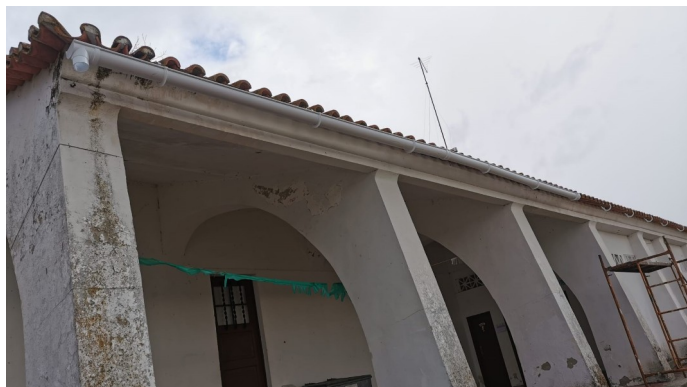
Edifício da Escola Básica de Palma com novas caleiras