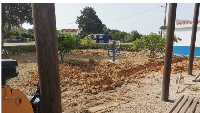
Sistema de rega instalado na zona de lazer do Barrancão

▲ Apesar de todos os condicionamentos que a pandemia da COVID-19 nos trouxe e tem trazido, a União das Freguesias de Alcácer do Sal e Santa Susana tem continuado a missão diária de melhorar a qualidade de vida das populações com um sem-número de intervenções no espaço público da Freguesia.