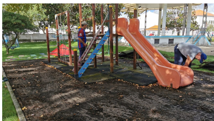
Renovação do Parque Infantil do Jardim Público de Alcácer do Sal