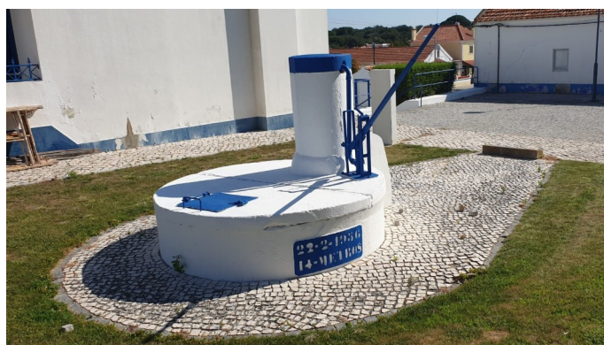
Intervenções de pintura e limpeza de espaço público em Palma