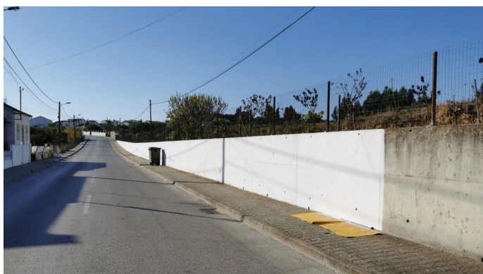
Manutenção e pintura de espaços públicos no Forno da Cal