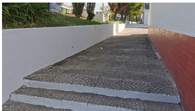
Manutenção e pintura de muros no Bairro do Morgadinho