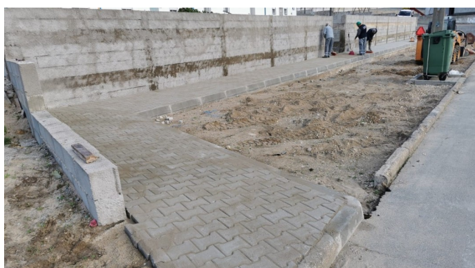
Colocação de pavês no novo Parque de Estacionamento de Arêz