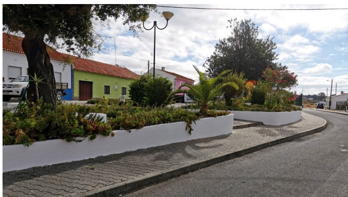
Pintura de muros e equipamentos em Monte Novo de Palma