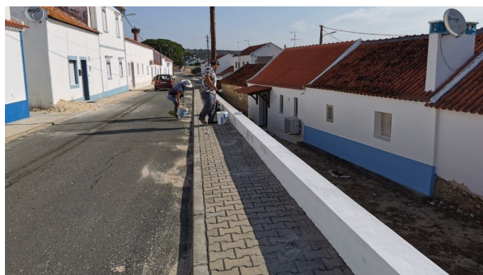
Trabalhos de pintura de muros e corrimões em Arêz