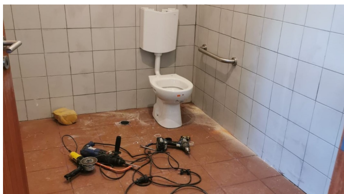
Remodelação de WCs em Foros de Albergaria