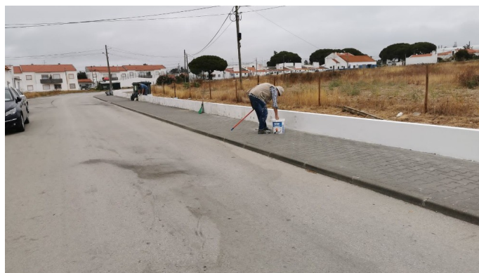
Trabalhos de limpeza e pintura no Bairro do Olival Queimado