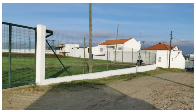
Intervenções de pintura em Santa Catarina de Sítimos