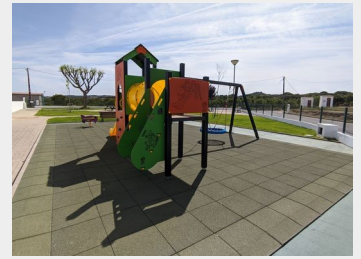
Requalificação integral do Parque Infantil de Santa Catarina de Sítimos