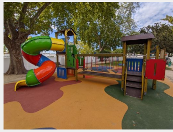
Construção do novo Parque Infantil do Jardim Público de Alcácer do Sal