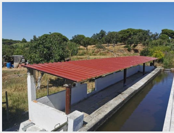
Cobertura em fibrocimento substituída no lavadouro de Arêz