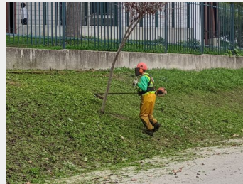
Limpeza de vegetação em inúmeros locais da Freguesia