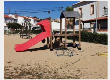
Trabalhos de manutenção no Parque Infantil da Quinta da Oriola