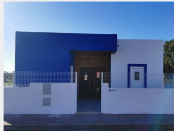
Nova Casa Comunitária de Monte Novo de Palma