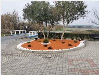
Arranjos exteriores na entrada da aldeia de Santa Catarina de Sítimos