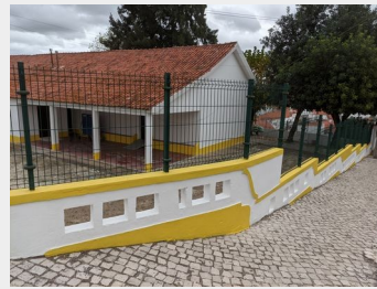
Pintura integral da Escola dos Açougues (interior e exterior)